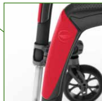
Protezioni laterali telaio integrate

Caratteristiche tecniche ed estetiche possono essere modificati in qualsiasi momento a seguito di variazioni di mercato o errori tipografici. Le immagini sono puramente indicative e non rappresentano necessariamente la configurazione standard