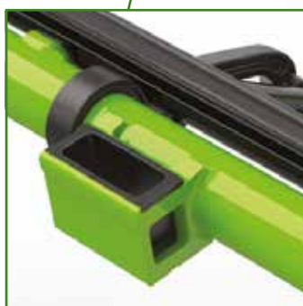
Supporto per braccioli integrato