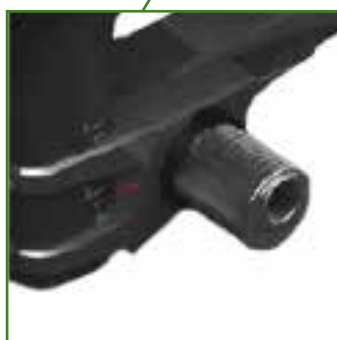
Piastra perno posteriore