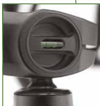
Livella a bolla