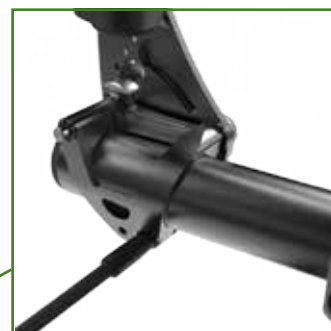
Barra d'irrigidimento posteriore in carbonio