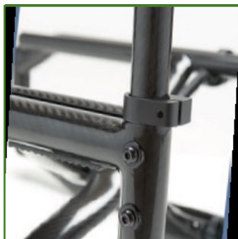
Rinforzo tubi schienale