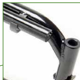
Tubi seduta in carbonio integrati nel telaio