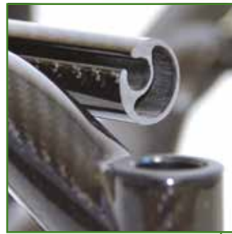
Tubi seduta in carbonio integrati nel telaio