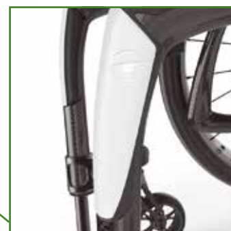
Protezioni antiurto integrate