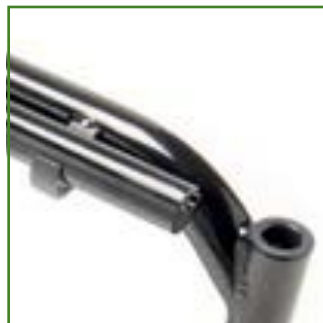
Tubi seduta integrati nel telaio