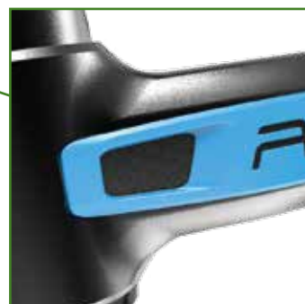
Paraurti forcelle anteriori