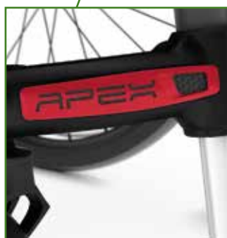
Paraurti forcelle anteriori