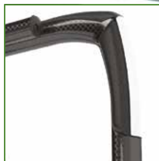
Imbottiture gel integrate