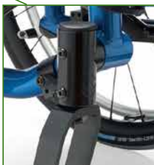
Alloggiamento per la regolazione delle forcelle integrato con sistema anti sfarfallamento ruote anteriori