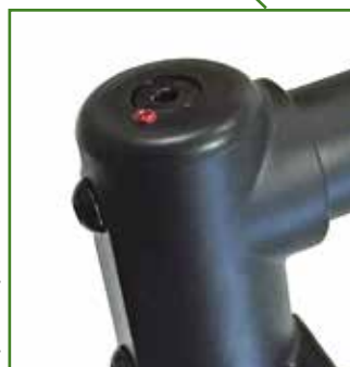
Sistema anti sfarfallamento ruote anteriori