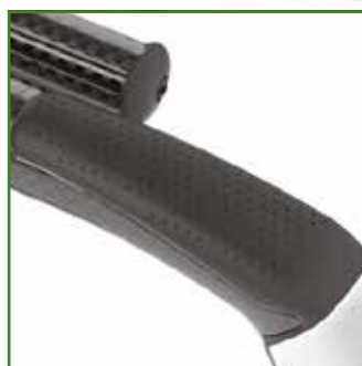
Supporti in PU antiscivolo per trasferimenti