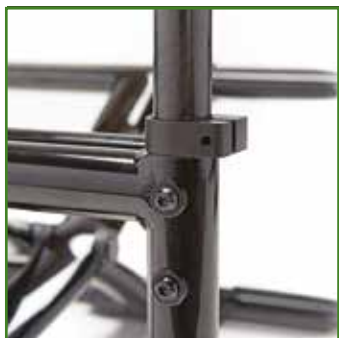
Rinforzo tubi schienale