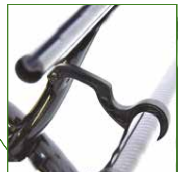
Barre stabilizzatrici leggere