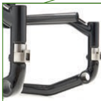
Telaio ibrido per altezze anteriori ridotte