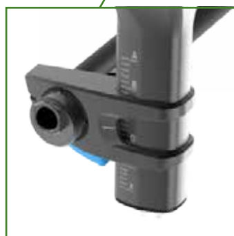
Piastra perno posteriore