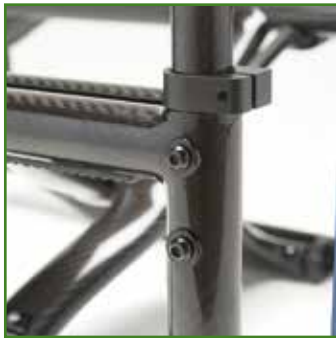
Rinforzo tubi schienale