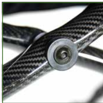
Sistema di chiusura ultra-rigido