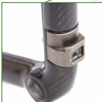
Alloggiamento regolazioni dell'inclinazione delle forcelle integrato