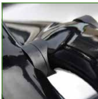
Crociera di design per massima rigidità