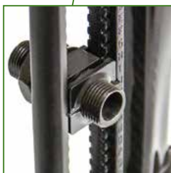
Innovativa piastra dell'asse posteriore