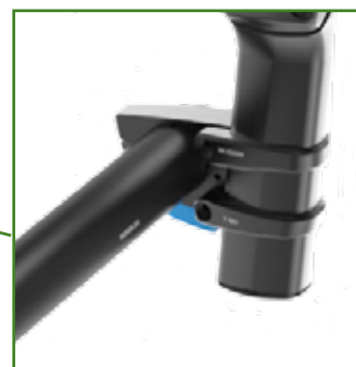
Asse di campanatura in carbonio