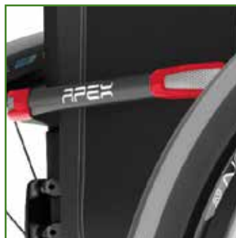
Barra d'irrigidimento in carbonio con catarifrangenti