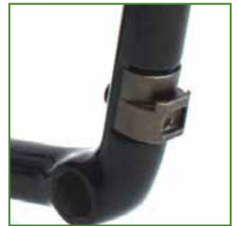
Piastra di blocco pedane integrata per protezione telaio