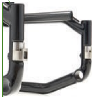
Telaio ibrido per altezze anteriori ridotte