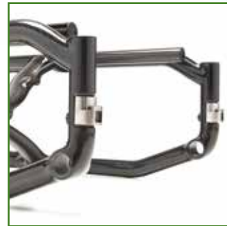
Telaio ibrido per altezze anteriori ridotte