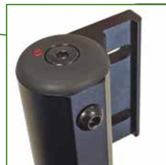
Sistema anti sfarfallamento ruote anteriori

Caratteristiche tecniche ed estetiche possono essere modificati in qualsiasi momento a seguito di variazioni di mercato o errori tipografici. Le immagini sono puramente indicative e non rappresentano necessariamente la configurazione standard